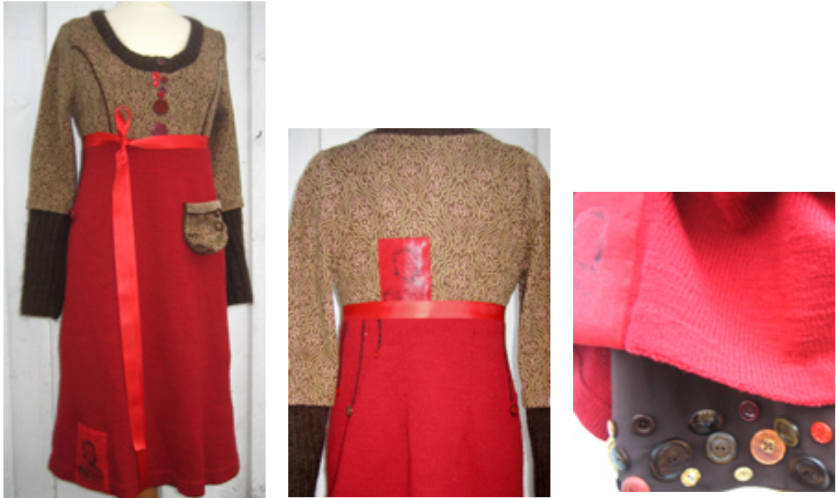
Figur 21: Bestemors brune kjole og røde skjørt har fått ett nytt liv!

Kjolen har blitt en "moderne" bestemorkjole. Utgangspunktet var omsøm. Med knapper og galskap har jeg fått frem et morsomt uttrykk. Mengdeforholdet mellom den mørke, brune fargen øverst og den lettere røde fargen nederst, gjør kjolen harmonisk. Kjolen er delt mellom liv og skjørt i det gyldne snitt.