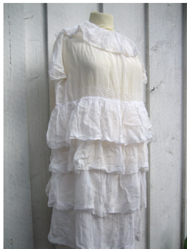
Figur 10: Kjolen er kjøpt av oldemor og omsydd ved flere anledninger.