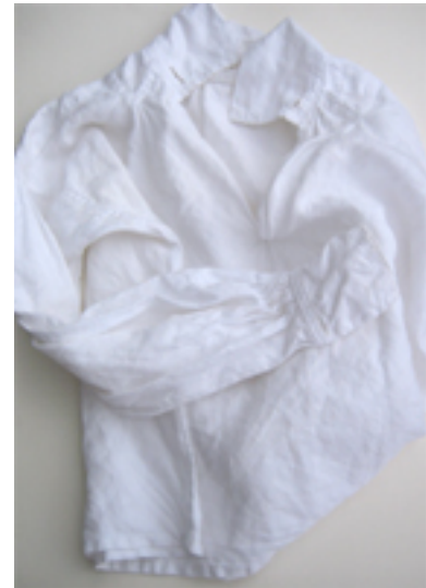
Figur 25: Den tradisjonelle bunadskjorta danner rammen rundt min fortelling om slekt og arv, tradisjon og tilhørighet.