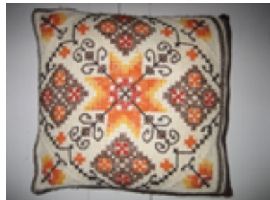
Figur 13: Utgangspunktet for jakka er ermene farmor har strikket, hennes broderte putevar og gardin. I tillegg en arvet genser fra 90-tallet og noen gamle bilder av farmor: Fotografier med glimt i øyet.