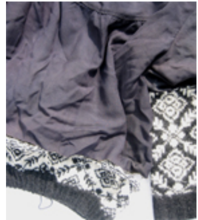
Figur 29: Et pyjamas-mønster fra en håndarbeidsbok fra 50-tallet danner utgangspunkt for blusens form.