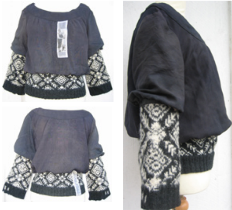
Figur 30: Dette skulle oldefar ha visst!

Lestene var utgangspunktet. Målet var et produkt som var mer moderne og enklere i form og uttrykk enn de andre, mer vågale produktene. Det synes jeg at jeg har oppnådd. Ballongformen på ermer og liv er tidsriktig, og gir blusen et moderne preg sammen med det sorte. Den strikkede kanten nede er strikket etter mønster av lestene. Det skjoldede, sorte viskosestoffet fungerer også godt sammen med de ikke helt sorte sokkene. Det gir blusen ett litt røft preg.