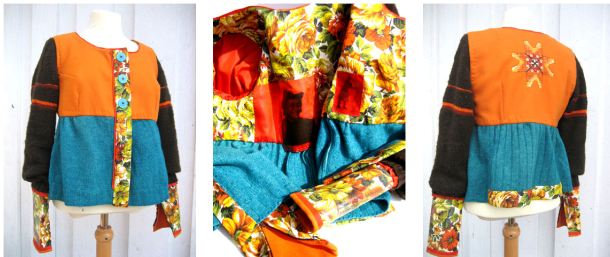
Figur 15: Nederst på ermene og inni trøya er det bilder av farmor. Stjerna på ryggen er fra ei gammel pyntepute.

Livet er tegnet etter et grunnmønster. Jeg arbeidet lenge med å klare og ”harmonisere disharmonien”. Ermene, puta og baderomsgardinene var utgangspunktet, resten har kommet til underveis. Da jeg skjønnte at trøyas nederste del måtte være i kontrast til oransje, og ikke en farge som var nær på fargeskalaen, falt brikkene på plass, og jakka fikk samtidig den spenst jeg ønsket og den samklang mellom fargene som var nødvendig. Materialenes sammensetning fungerer godt: De understreker hverandre. Sammen med et nøyaktig håndverk og god komposisjon, løftes de gamle tekstilene opp til de skatter de jo er.