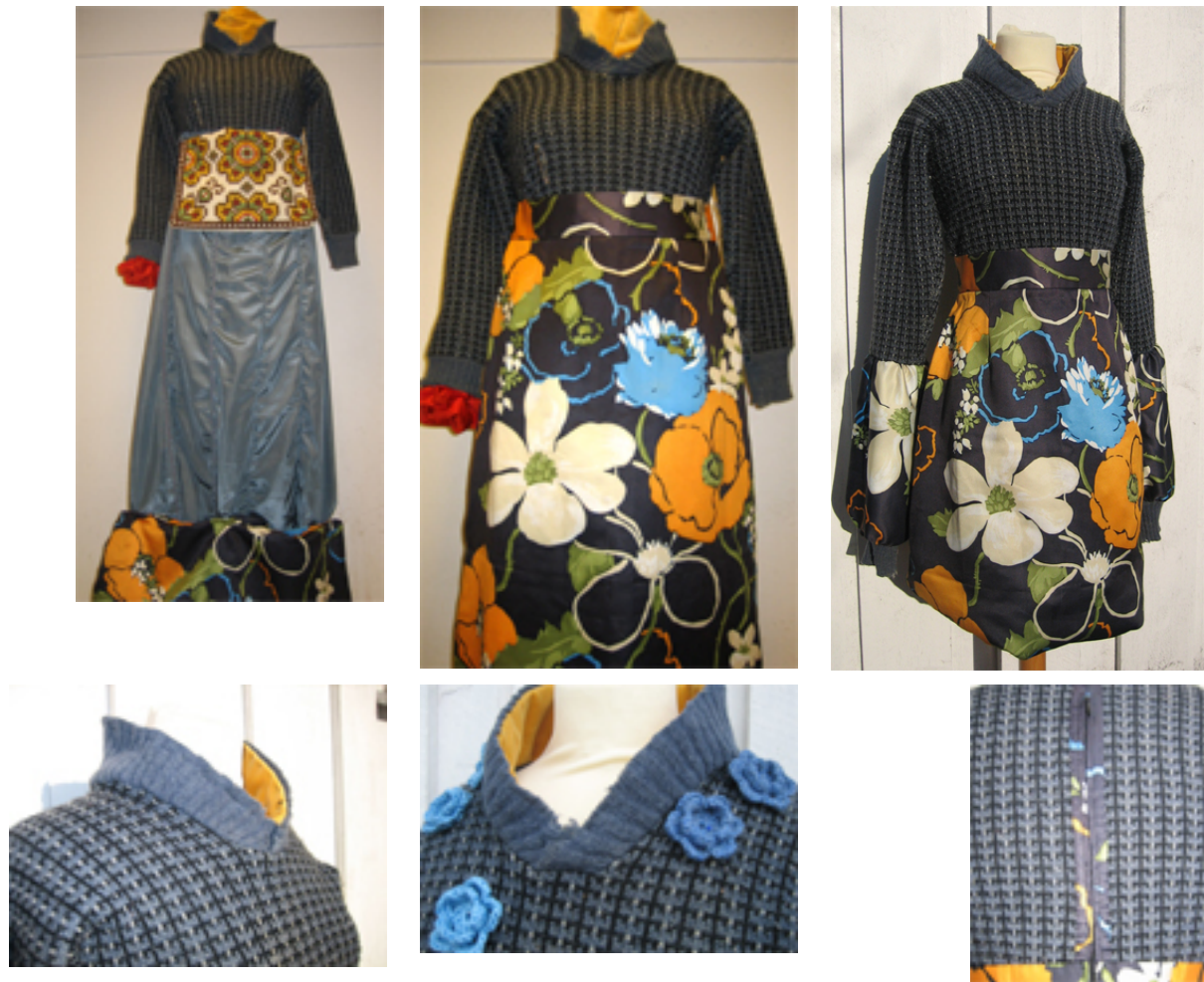
Figur 23: Jeg vurderte til å begynne med også andre stoffer jeg hadde liggende, slik bildet øverst til venstre viser.