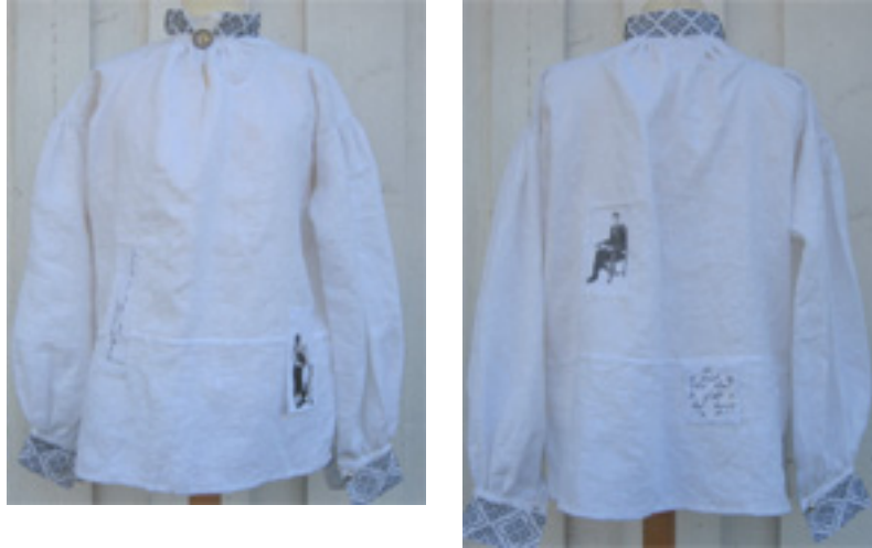
Figur 27: Ferdig skjorte

Mønsteret til skjorta har jeg kopiert fritt etter Aamli-bunadens mannskjorte. Det er ideen og komposisjonen som er det bærende ved dette produktet. Jeg arbeidet lenge med de ulike elementene, bilde, skrift, materialer og broderi, for å få en harmonisk helhet. Jeg ønsket at lappene skulle være bærende element i skjorta som symbol på gjenbruk og reparasjoner, og som historieforteller ved bilder og skrift. Jeg har brukt to ulike materialkvaliteter i lappene, et grovt og et fint linstoff. Men med lik farge. Broderiet er stramt og enkelt. Det var en utfordring å gjøre bildene og skriften like lett i uttrykket, slik at det ble en harmonisk helhet over skjorta.