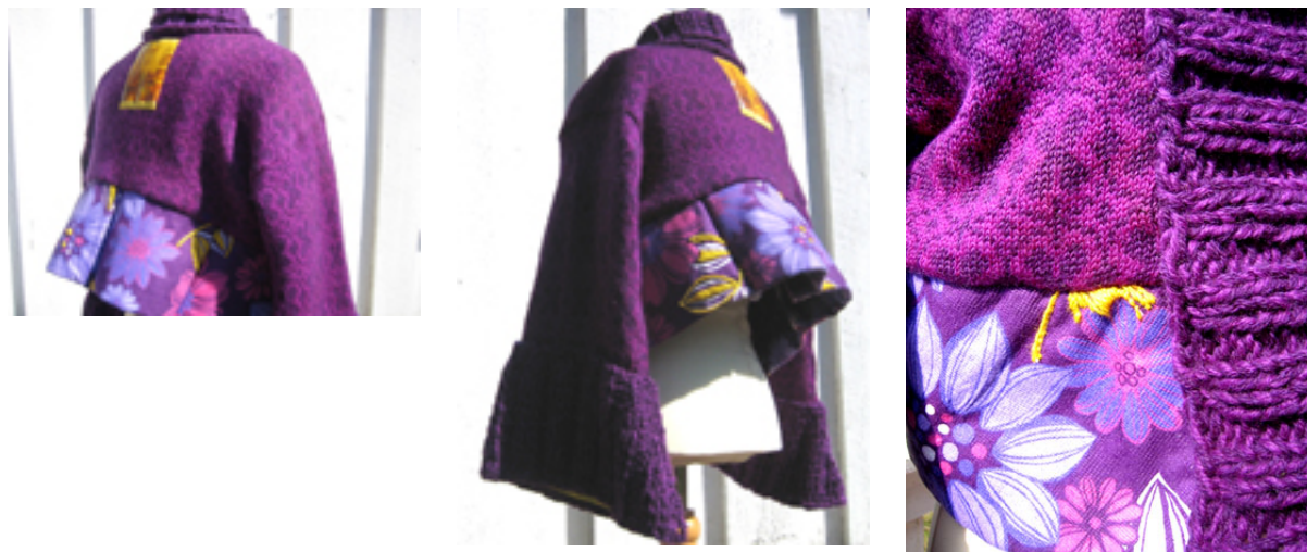
Figur 18: Ei fjøsjakke har blitt festjakke!

Formen på bolen og ermene har jeg jobbet mye med. Først da jeg fikk løftet skonningen nederst på jakka høyt nok opp på ryggen, ble jakka lett og god å se på. Ermene er bevisst gjort litt kortere enn normal lengde. Dette er for å unngå at de skulle føles for tunge og trekke ned det lette uttrykket. At den strikkede kanten framme går helt ned foran, får den til å virke strammere enn om jeg hadde valgt å gjøre den kortere enn jakkas hele lengde, slik jeg først hadde tenkt.