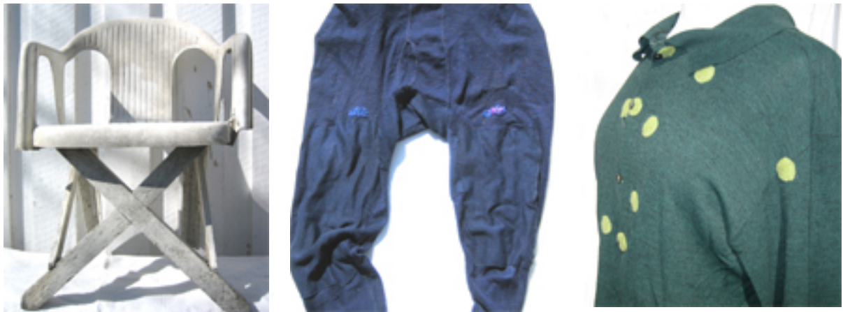
Figur 7: Min tradisjons faste element slik de kan uttrykke seg i konkrete gjenstander av farfar, mor og meg.

De faste element som "tid", "nøysomhet", "forbilder" og "glede" er de "ryggmargsrefleksene" som danner grunnplattformen i min slektstradisjon. Det er tradisjonens faste element. Bildet til venstre i Figur 7 viser for eksempel hvordan elementet nøysomhet kan gjøre seg gjellende: Farfar har reparerte verdens mestselgende (og styggeste ?) stol til 49,90. Han hadde tid . Og mor har alltid