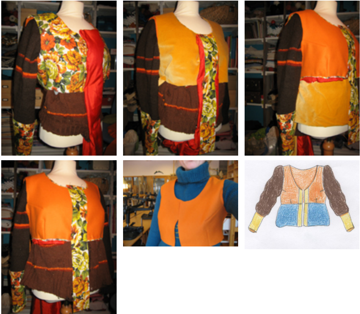
Figur 14: Arbeidsprosessen viser problemene med å balansere fargene og stoffene mot hverandre for å skape harmoni.