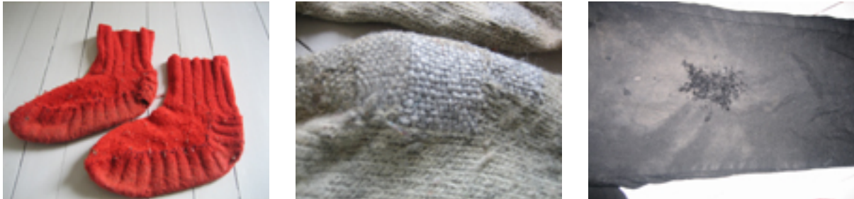
Figur 1: Farmors grovt reparerte strømper til venstre, mormors perfekte stopp i midten og farfars "lapping" til venstre.

Jeg opplever at mange på min egen alder også har opplevd mødre og bestemor som stopper og lapper – ikke kaster. Men jeg møter sjelden jevnaldrende som bærer denne tradisjonen videre. De kjøper nytt når noe går i stykker. Noen forteller at de leverer strikkede strømper til mor for stopping, og slik fortsetter de tradisjonen på et vis. Men hvem skal stoppe når deres mødre blir for gamle?