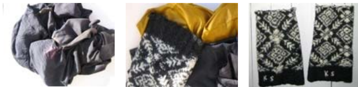
Figur 28: Et mislykket, farget stoff og oldefars lester skal bli en moderne bluse.