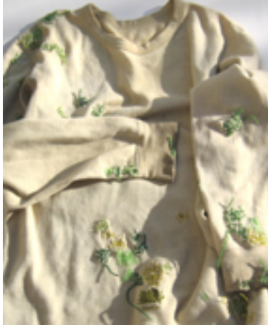
Figur 11: Ull-undertrøya er eget arbeid.