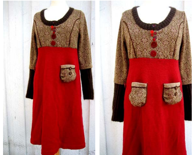
Figur 20: Farger, materialer og elementer skal kombineres og balanseres mot hverandre.