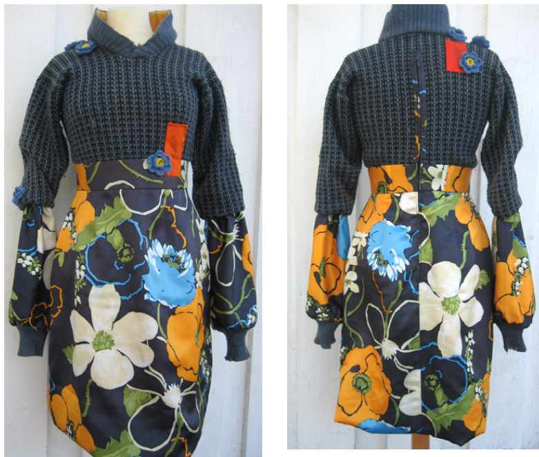
Figur 24: ferdig kjole.

Fars skigenser er slitt, og har blitt stoppet av meg flere steder. I tillegg har den ”nupper”. Overdelen står i kontrast til det blanke stoffet i skjørtet og ermene. Skjørtet fra tidlig 70 tall er igjen tidsriktig i mønster og farger. Kjølens ballongform er også moderne. Jeg synes jeg har klart å nytte genseren uten at resultatet har blitt forringet av dens slitasje, men heller har hevet plagget og gjort kjolen spennende. Jeg har lagt vekt på å stoppe slitte steder og hull i genseren så usynlig som mulig for ikke å gjøre genseren mer slitt enn nødvendig. Her har jeg for en gangs skyld arbeidet etter bestemors prinsipp om ”helt og pent”.