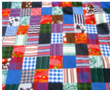
Figur 12: Teppet er eget arbeid.