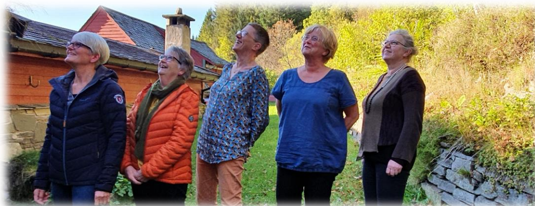
Kjem dei gode ideane derfrå snart? Frå arbeidsmøte på Osterøy.