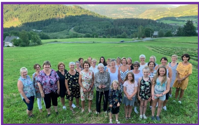
Bilete av bygdekvinner i Bjørgum Bygdekvinnelag er tatt av Ørjan Brattetveit.

aktivitetar på dagtid, som mange andre lag. Medlemmane har og mykje program i helgene, slik at våre aktivitetar for det meste må føregå på kveldstid og litt laurdagar.