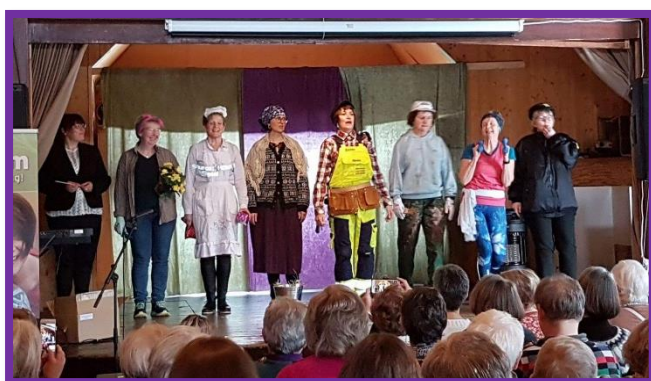
Bjørgum BKL hadde ei framifrå flott framføring.

kaffien vart det anislefser. Desse rettane finns i Tradisjonsmat oppskriftsheftet som Bjørgum Bygdekvinnelag har laga.