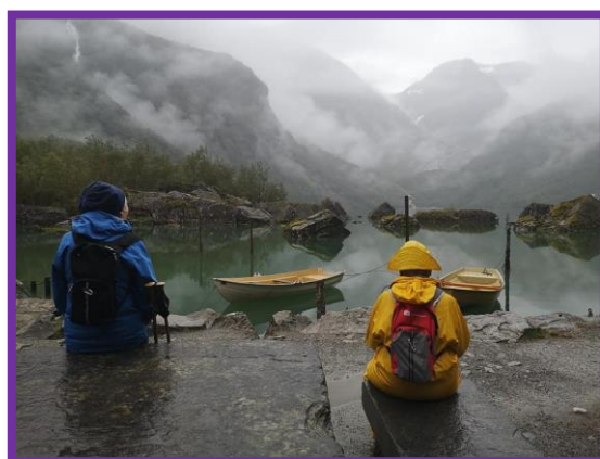
Tur til Bondhusvatn.

Omvikdalen Bygdekvinnelag helsar årsmøtet og ønskjer lukke til med gjennomføringa.