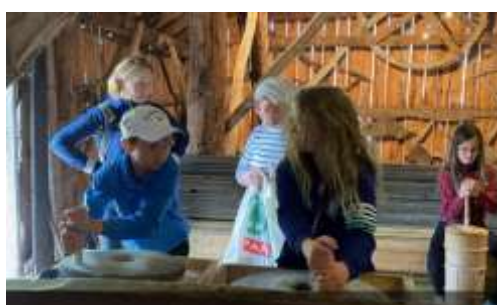
Kulturdager på Tresfjord museum