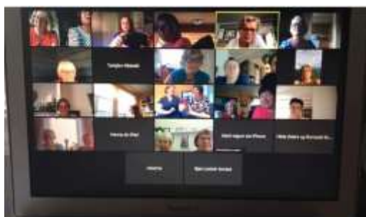
Videomøte den 02.06.2021

Det er meldt om 28 ulike oppslag i media. 6 lag har aktivt brukt forslag til leserinnlegg fra NBK. Team: nedleggelse av bofellesskap i bygda, kunstutstilling, overrekkelse av båreteppe til sjukeheimen, handle lokalt-dagen, lunsj til Tine fotballskole, trussel om nedleggelse av barnehagen i bygda, høsttakkefest.