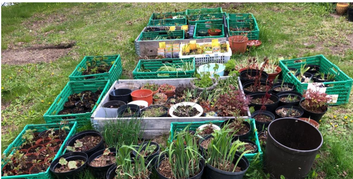
Deler av vareutvalg av stauder, urter og blomster til grøntloppemarked i 2020.