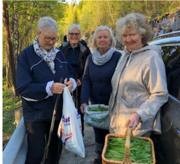
Vårens ramsløktur til Lier var en stor suksess.