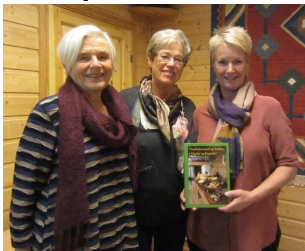
Vi har hatt mange flotte foredragsholdere;