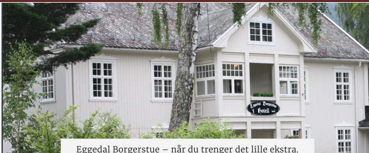
Eggedal Borgerstue – når du trenger det lille ekstra.