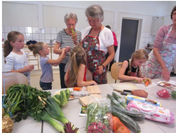
Vi lager mat av rotgrønnsaker med 4.-5. klasse Nerstad skole

Deltakere på medlemskveldene er i gjennomsnitt 20-25 stk. Vi hadde også bakedager i en barnehage, samt kurs i fermentering av grønnsaker. Fra mars 2020 måtte alle arrangement avlyses, men vi greide å arrangere nytt årsmøte 14. oktober 2020.