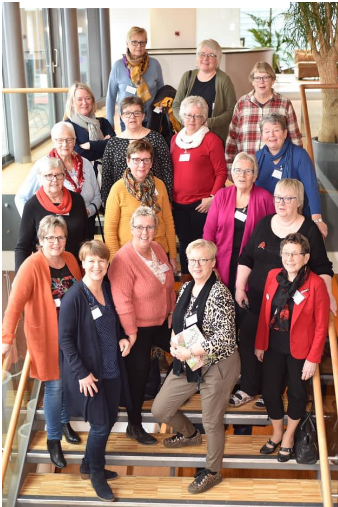
Hedmarkinger på NBK Inspirasjonsseminar