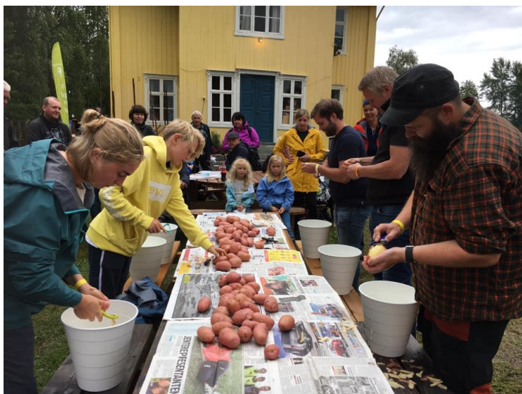
De Nordiske Jakt- og Fiskedagene i august, med stand og potetskrellingskonkurranse