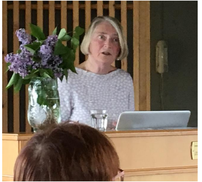
Bygdestreif i Tynset juni 2019