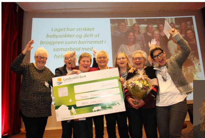
Norges Bygdekvinne lag utnevnte Frogn Bygdekvinne lag til ÅRETS LOKALLAG

med Nyttig informasjon til arbeidet i lokallagene