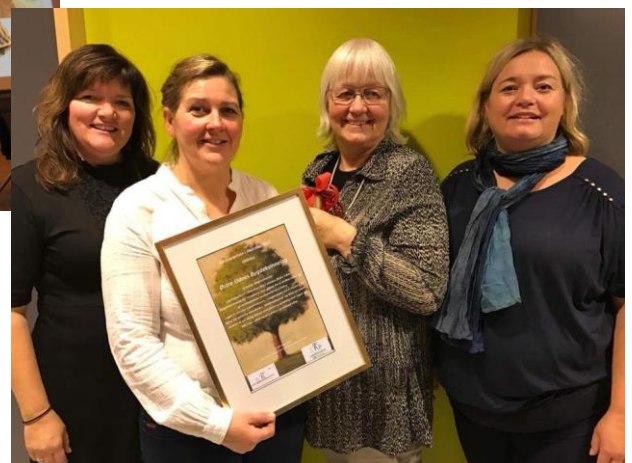
Voksenopplæringsforbundet i Akershus tildelte Østre Udnes Bygdekvinne lag LÆRINGSPRIS 2017